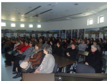
Στις 6 Μαρτίου επισκέφτηκαν το Κέντρο μας ομάδα Φίλων και Μελών της Δημοτικής Βιβλιοθήκης Λιβαδιών