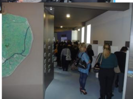
Επίσκεψη Ορειβατικού Ομίλου Λεμεσού στις 9 Μαρτίου 2014