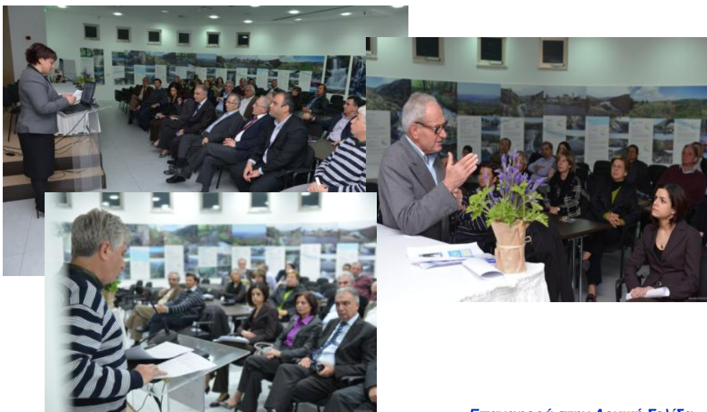
Επαναφορά στην Αρχική Σελίδα

Η έκθεση φωτογραφίας θα φιλοξενηθεί μέχρι τις 31 Αυγούστου 2014, στο Κέντρο Περιβαλλοντικής Ενημέρωσης Ορεινής Λάρνακας.